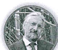
MASSIMO TAVOLA SECONDARIA DI PRIMO GRADO