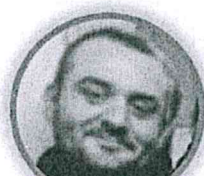
ROBERTO ZOLLO SCUOLA PRIMARIA