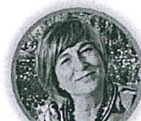
GIOVANNA MARIA BURRELLI SCUOLA PRIMARIA