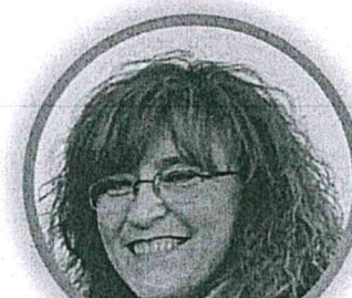
MARIANGELA MAPELLI SCUOLA PRIMARIA